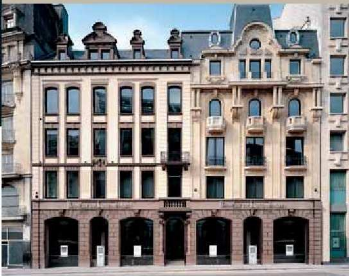
_ Luxemburg-Bahnhof 80, place de la Gare