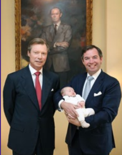
Grand-Duc Henri et le Grand-Duc Hérédier