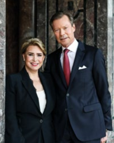
Le Grand-Duc et la Grande-Duchesse