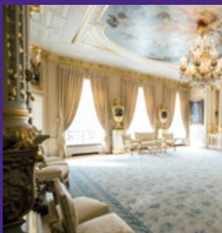
Salle des fêtes