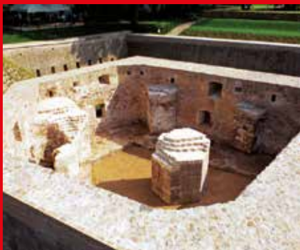
D « Schänzchen »