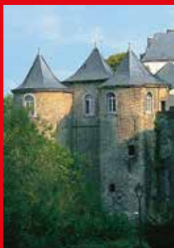
3 Trois Tours