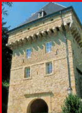
4 Tour Vauban, Porte des Bons Malades