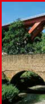
5 « Béinchen »

l'enceinte fortifiée de la ville en 1685. Il renforça les hauteurs par deux forts et verrouilla la vallée au moyen d'un mur de protection qui reliait le Fort Berlaimont du côté ville aux nouveaux forts des hauteurs du Grünewald de l'autre côté. Vauban assura également la défense de la vallée en y érigeant ces deux tours défensives. De plus, des fossés profonds (mis à jour en 1997/98), des ponts basculants lourds et des meurtrières tenaient l'ennemi à l'écart. Si toutefois celui-ci réussissait à s'approcher d'une tour, il y avait toujours la possibilité de l'arroser de poix ou d'huile brûlante versée par les ouvertures (mâchicoulis) de la galerie en encorbellement. Par les portes de l'étage supérieur, on accédait au chemin de ronde des murs de protection.