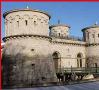
8 Fort Thüngen, Musée Dräi Eechelen

En 1684/85, Vauban fit construire la Porte du Grünwald, dite « Höhlentor », pour assurer la défense de l'étroite vallée transversale de l'Alzette par laquelle passait l'ancienne route romaine vers Trèves (aujourd'hui rue des Trois Glands). La tour, renforcée par un fossé, un pont-levis et un mâchicoulis, fut ultérieurement transformée et exhaussée d'un étage. Les murs de protection adjacents furent démolis en 1875. Presque entièrement préservés sont les trois dépôts à farine situés sur un seul étage un peu en contrebas de la porte. Au-dessus de la Porte du Grünwald s'ouvre un chemin forestier étroit qui nous mène de nouveau vers les hauteurs. Nous traversons les vestiges du 7 Fort Obergrünwald , devant lesquels nous repassons avant de découvrir le Fort Thüngen. Les vestiges de ce fort, qui doit son nom au sergent général de bataille Adam Sigismund von Thüngen, disparurent sous une couche de terre lors du démantèlement de 1876. La transformation du site Dräi Eechelen en parc par des paysagistes en fit un lieu de récréation et de détente pour la population.