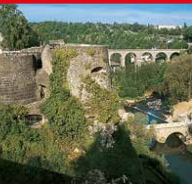
1 Rocher du Bock