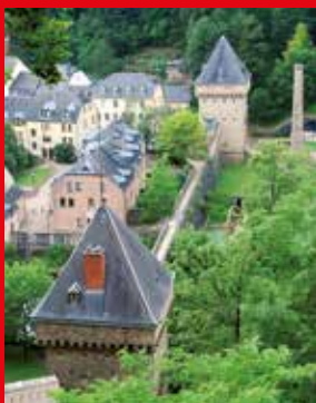
4 Tours Vauban, Pfaffenthal