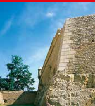
7 Fort Obergrünwald