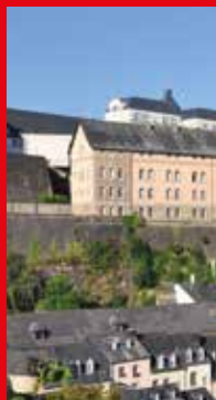
A Plateau du Rham