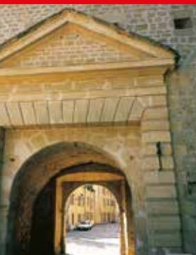
4 Tour Vauban, Porte d'Eich