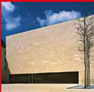
2 Musée National d'Histoire et d'Art, Marché-aux-Poissons

Le point de départ du circuit Vauban est le 1 Rocher du Bock , promontoire rocheux environné de pentes escarpées dont le comte Sigefroi avait reconnu l'importance stratégique de son emplacement lorsqu'il y érigea son château fort au X e siècle, véritable berceau de la future ville haute. Après que le château fort fut détruit et tombé en ruines fut construit sur le Rocher du Bock, sous domination habsbourgeoise et espagnole jusqu'en 1620, un premier fort qui fut détruit en 1684 lors de la prise de Luxembourg par les Français. Ensuite, Vauban fit reconstruire les anciennes fortifications du Bock sans trop les modifier. Ce n'est qu'ultérieurement, sous le règne de Marie-Thérèse, que le fort fut renforcé de vingt-cinq chambres à canons souterraines, les casemates du Bock (1744-45).